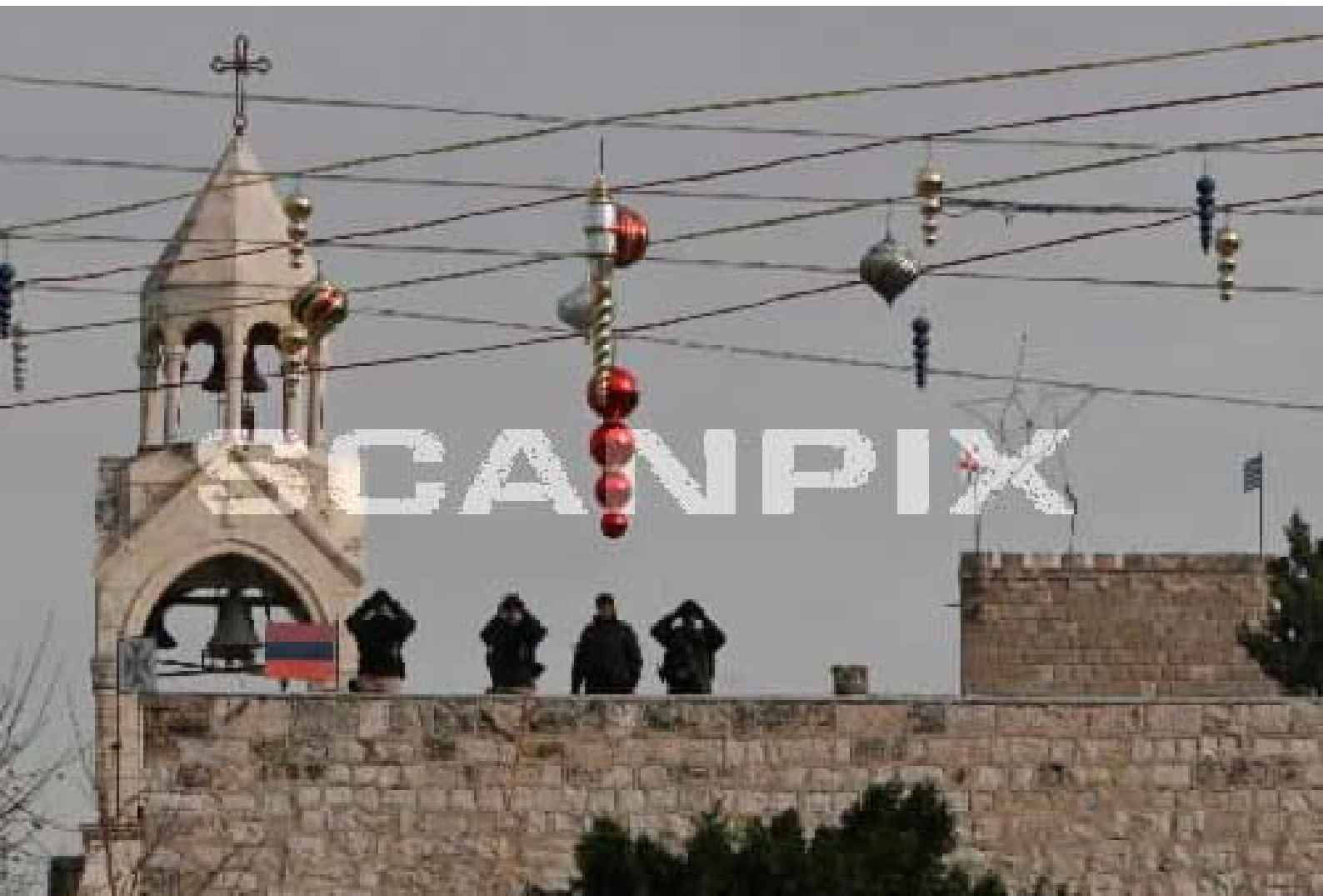
Amerikanske og palestinske tryggleiksoffiserar står vakt på Fødselskyrkja i Betlehem.

og pilegrimsvandringane, var området fullt av menneske på reise. Som kjent fekk jo nokon ein stall å sove i når det var fullt på herberget. Byen var knutepunkt for handelsmenn og folk blei tekne vennleg imot.