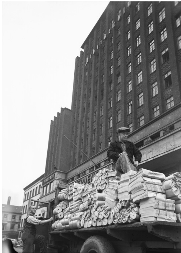
Folketeaterbygningen 1946