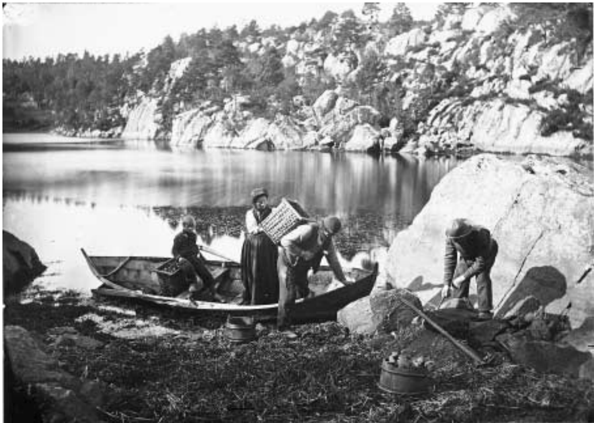
Parti fra Tysnæsøen, 1872

Formidling av fotografier representerer for mange billedsamlinger en mulighet for inntjening. Billedsamlingen har derfor en økonomisk interesse av at andre ikke "skummer fløten" av billedsamlingens arbeid ved å kjøpe opp eksemplarer for videre utnyttelse. Etablert praksis i mange billedsamlinger er å leie ut materiale for publisering, mens salg bare gjøres til privat bruk. For å unngå ulovlig eller uønsket bruk av billedsamlingens materiale, bør det alltid inngås en skriftlig kontrakt med mottakeren der billedsamlingens vilkår for utleien eller salget kommer klart fram.