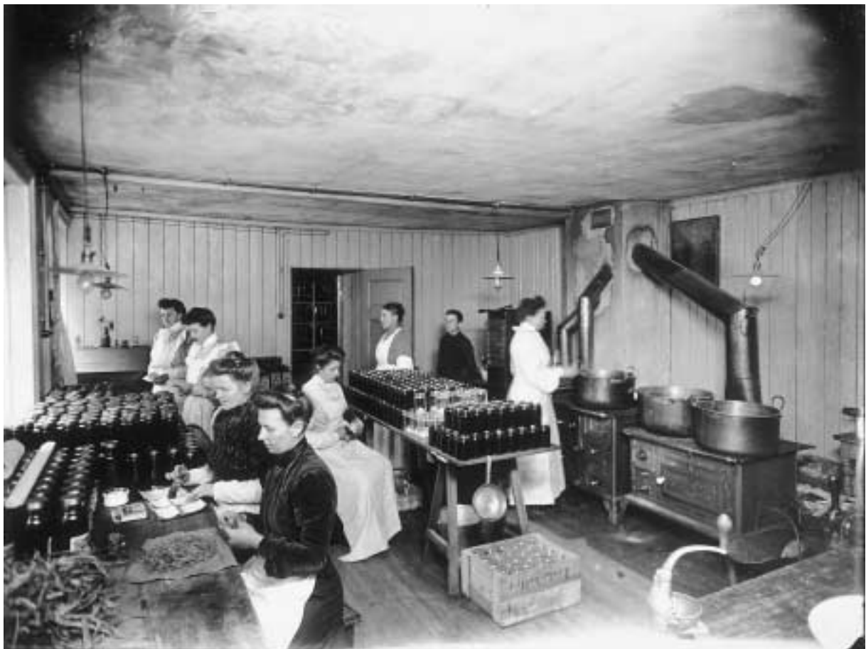
Gulsmed C. Bergs verksted, ca. 1910