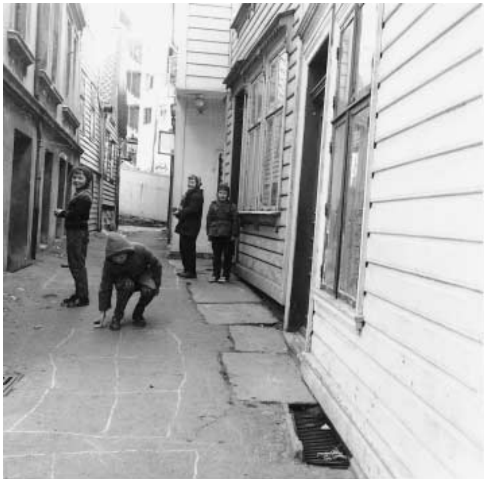
Halvkannesmuget, Bergen 1958